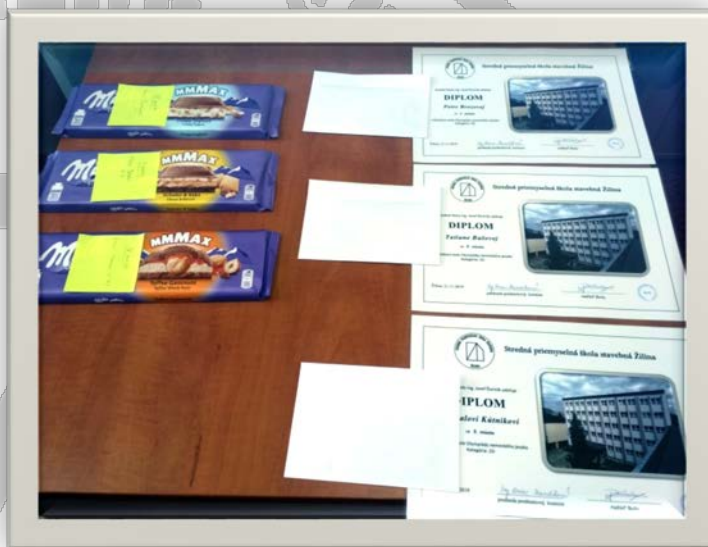
Diplomy a odmeny z prostriedkov ZRŠ