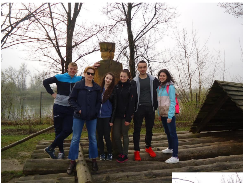
Turistika v okolí Váhu