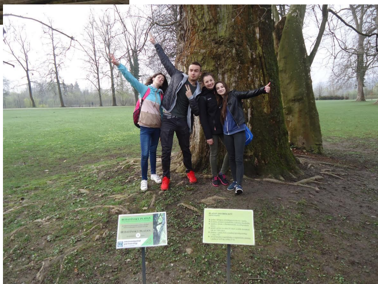
V budatínskej záhrade