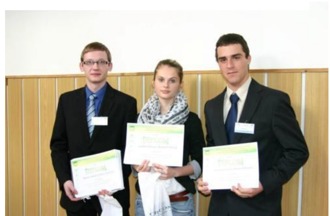
Úspešní žiaci na okresnom a krajskom kole SOČ