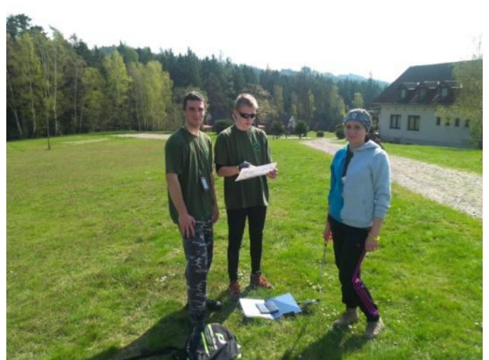
na stanovišti č.1 Trigonometrické určovanie dĺžky