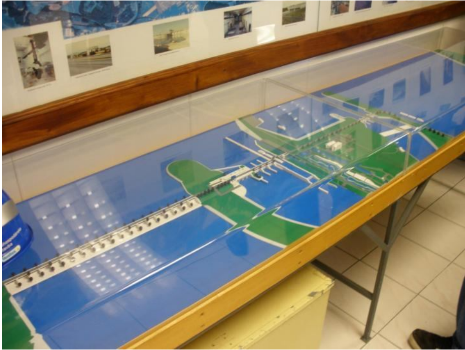
Maketa vodného diela