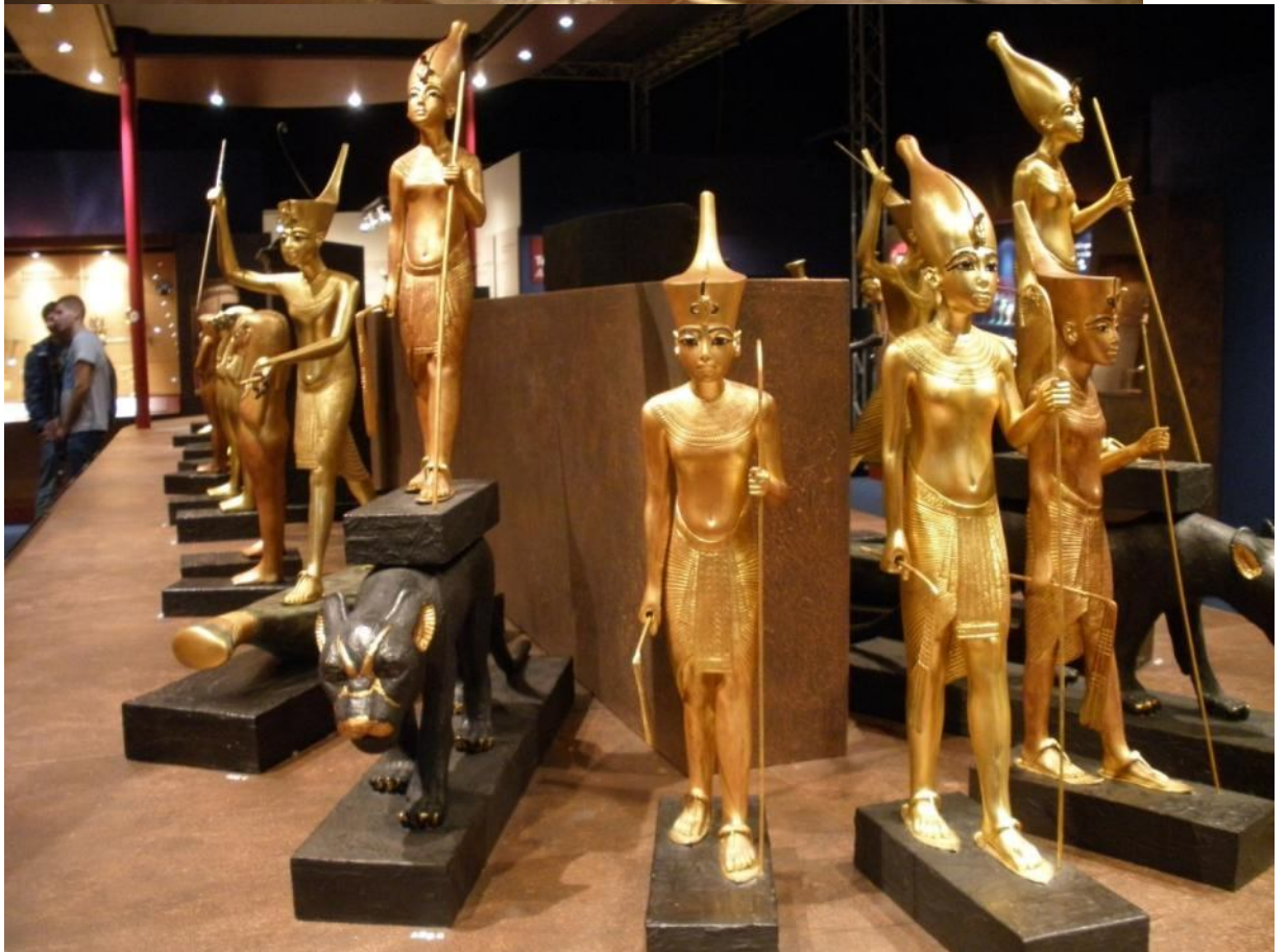
Artefakty, ktoré sa našli vo faraónovej hrobke