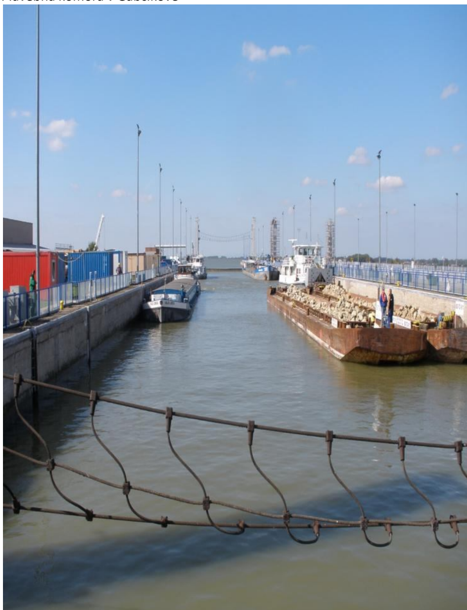
Plavebná komora v Gabčíkove