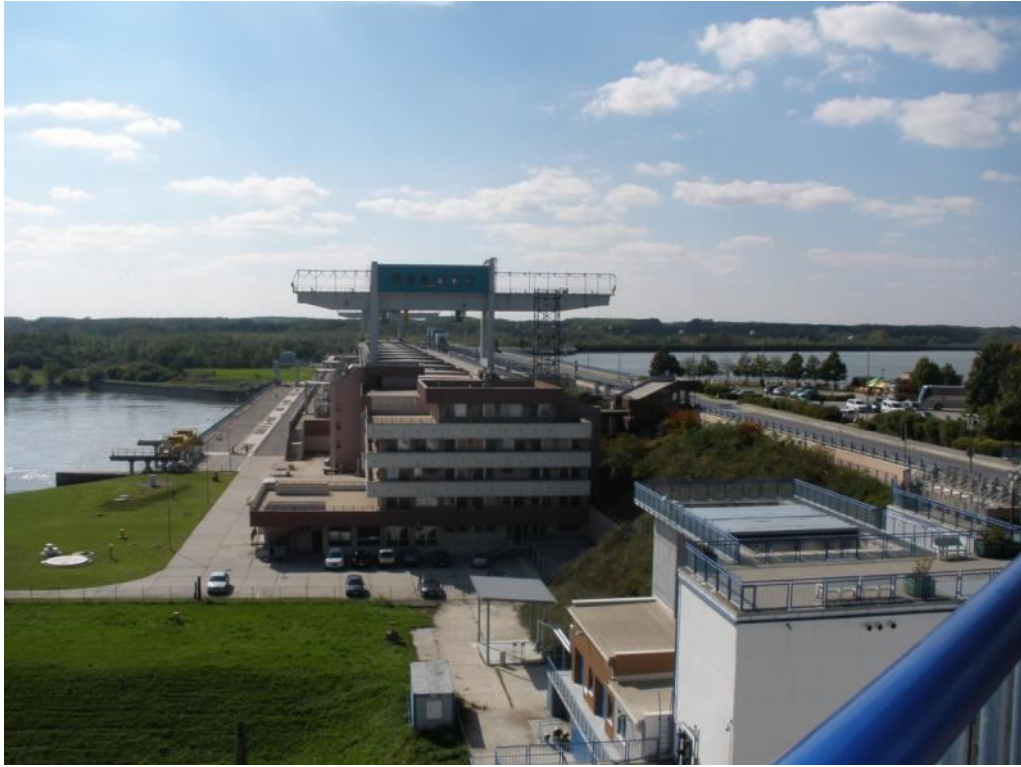
Celkový pohľad na pracoviská