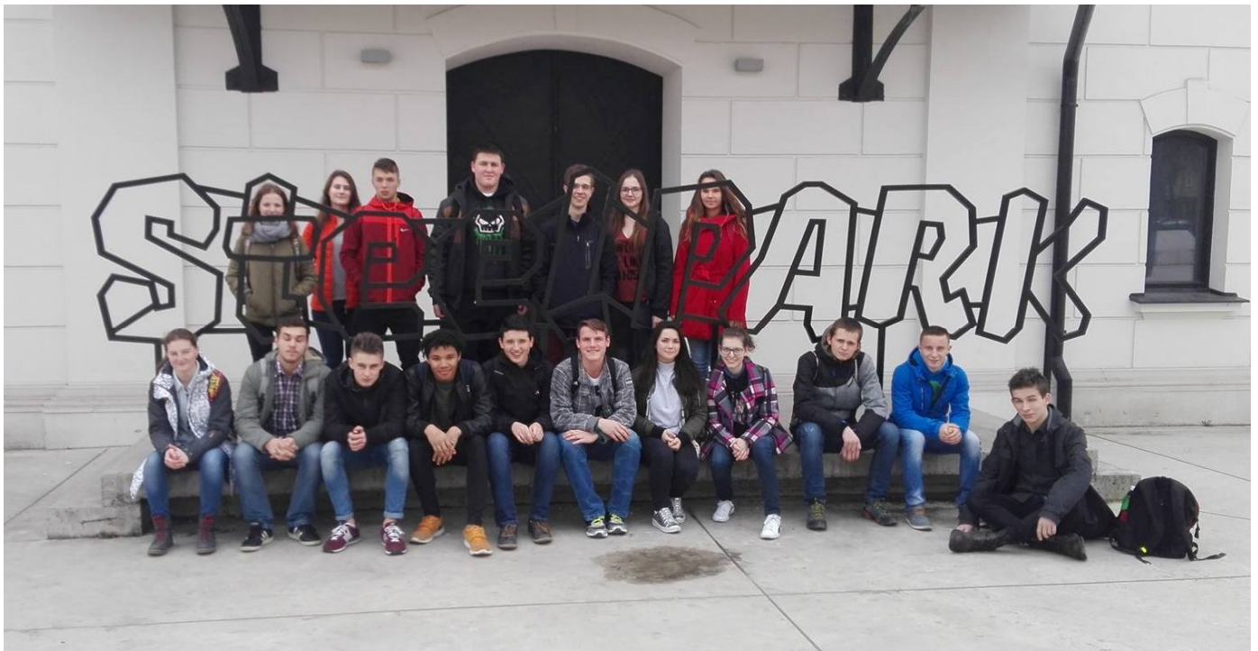
Účastníci odbornej exkurzie