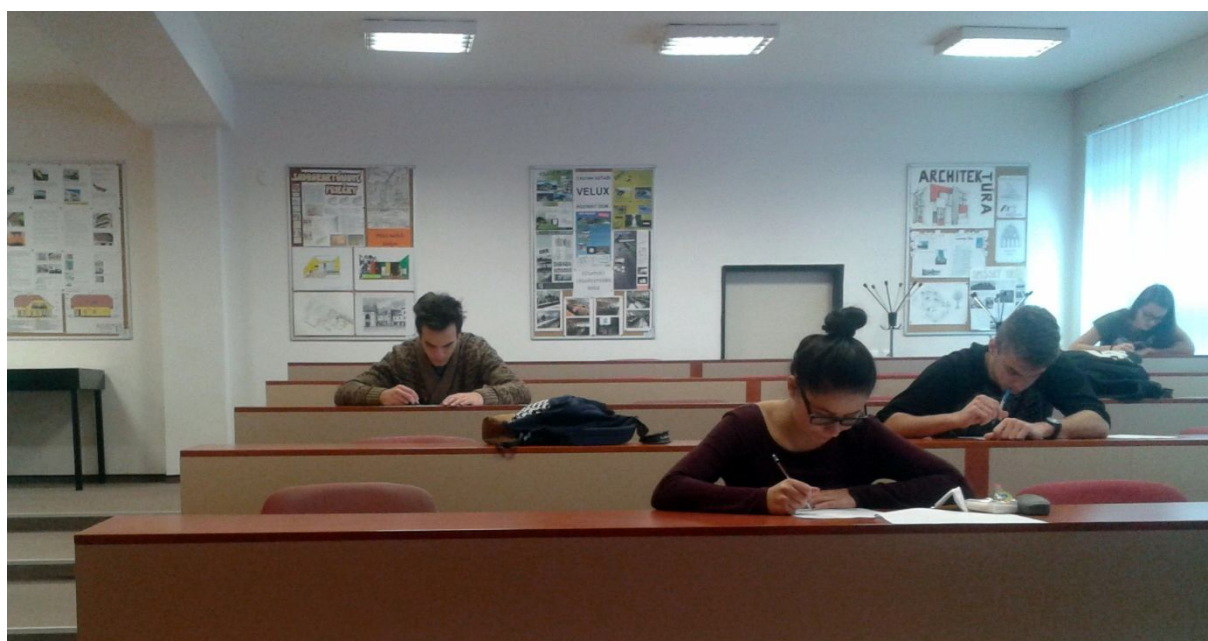
písomná časť olympiády z nemeckého jazyka