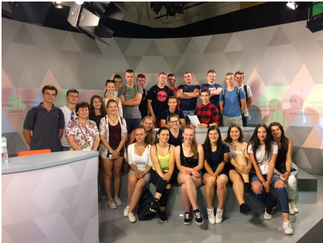
2.G v štúdiu RTVS v Banskej Bystrici

28.6.2017 sme sa vybrali na exkurziu do RTVS v Banskej Bystrici. Lebo aj druháci stavbári a geodeti sa chceli dozvedieť, ako fungujú médiá. Ráno sme nasadli na vlak a v pekne horúcom počasí sme dorazili na miesto. Síce nás po ceste trochu zradila navigácia (znenazdajky sme sa ocitli medzi bagrami na stavenisku), ale nakoniec sme šťastne dorazili do cieľa – RTVS v Banskej Bystrici.