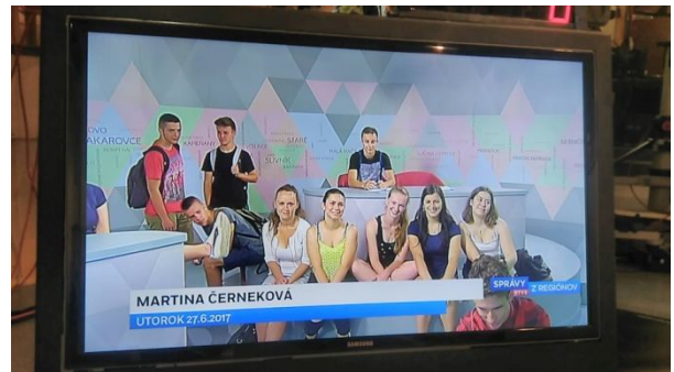
Prestávka vo vysielaní

Nakoniec sme sa dostali aj do živého vysielania rádia, kde práve prebiehala relácia s políciou o bezpečnosti a žiaci tak mohli vidieť, aká nálada panuje v živom vysielaní, ako musí pracovať moderátor, ako sa púšťajú džingle, reklamy a iné predely.